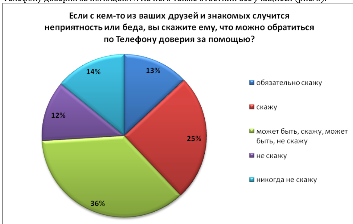
Рис. 3. Готовность порекомендовать совершить звонок другим людям

Заключительный вопрос анкеты звучал следующим образом: «Если с кем-то из ваших друзей и знакомых случится неприятность или беда, вы скажете ему, что можно обратиться по Телефону доверия за помощью?». На него также ответили все учащиеся (рис. 3).