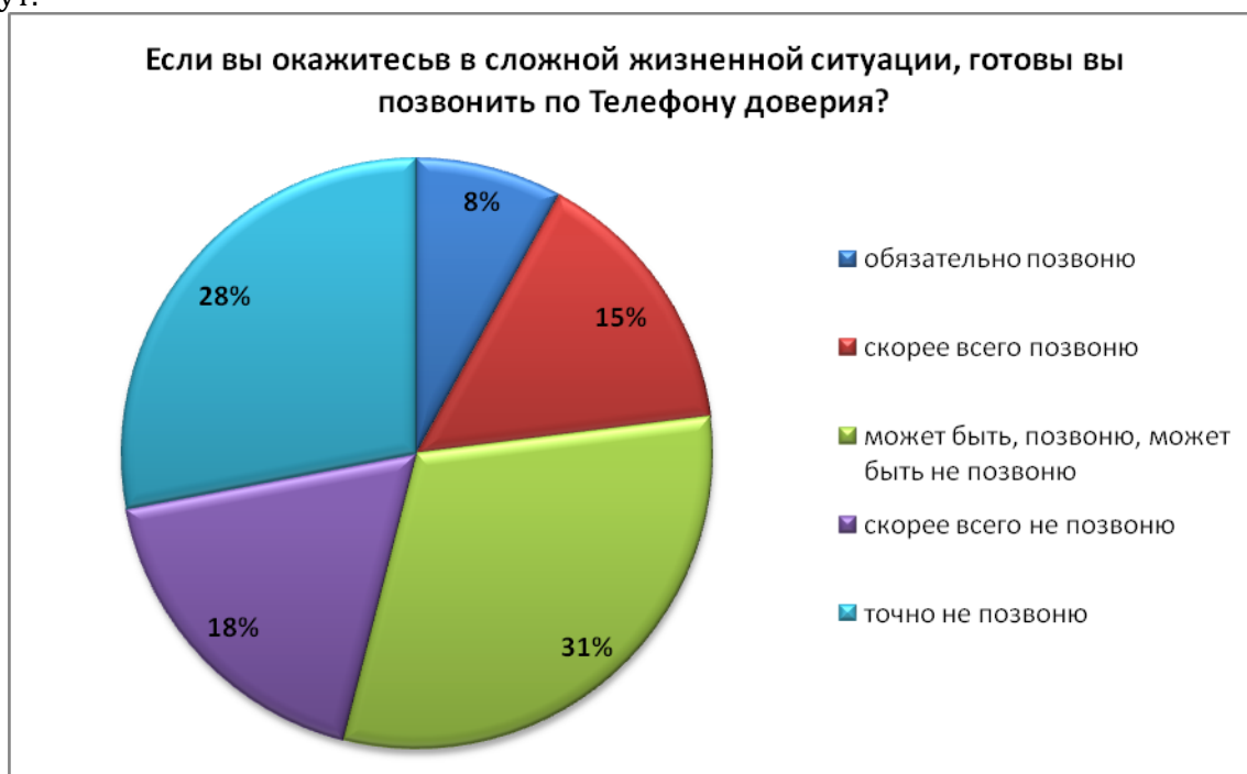
Рис. 2. Степень готовности позвонить по Телефону доверия у подростков

Исследуя готовность обращения за помощью в сложной жизненной ситуации на Телефон доверия, мы обнаружили, что на данный вопрос ответили все респонденты. Ответы распределились следующим образом (рис. 2): выразили готовность обязательно позвонить только 8% учащихся; «скорей всего, позвоню» – так решили 15%; высказали сомнение в совершении звонка большинство школьников – 31%; 18% решили для себя, что, скорей всего, они не позвонят по Телефону доверия, а 28% уверенно заявили, что точно звонить не будут.