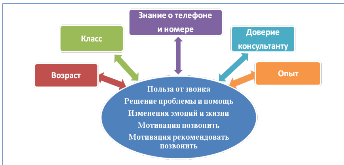
Рис. 4. Взаимосвязь характеристик информированности школьников VII–IX классов о Детском телефоне доверия

Результаты корреляционного анализа позволили выявить взаимосвязь между возрастом, классом, знаниями о существовании Телефона доверия и его номере, доверии консультанту и опыте звонков с оценкой результативности звонка в широком смысле (польза, решение проблемы, изменение эмоций и жизни) и мотивацией позвонить в будущем или порекомендовать звонок друзьям (рис. 4).